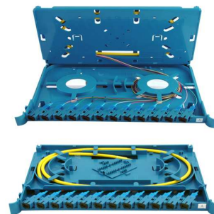
Przełącznica optyczna 96 (5U)