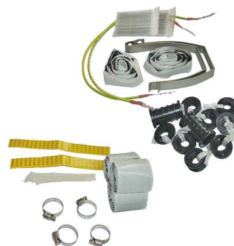
Podstawowe elementy wyposażenia